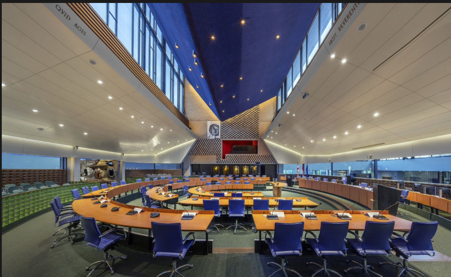
Statenzaal provinciehuis van Noord-Brabant. Het door Huig Maaskant ontworpen Brabantse provinciehuis uit 1971 in Den Bosch is het enige brutalistische provinciehuis in Nederland. Het brutalisme, ontleend aan 'béton brut' (ruw beton,) werd lange tijd vooral verafschuwd, maar ondergaat de laatste jaren een opmerkelijke herwaardering.