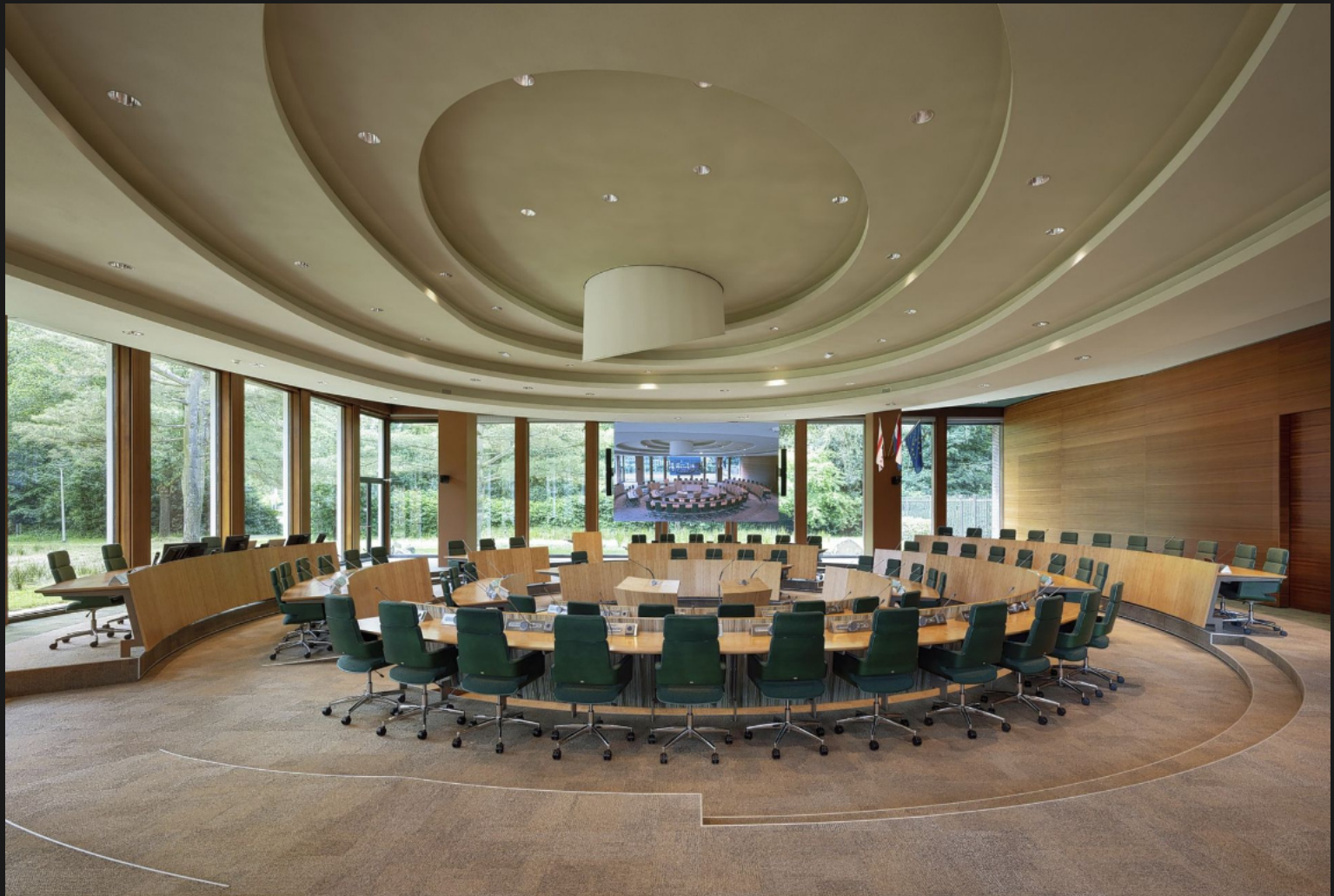
Statenzaal provinciehuis Drenthe. Marius Duintjer, architect van het provinciehuis uit 1973, gaf de statenzaal een ronde vorm, een verwijzing naar de Balloërkuil waar volgens een mythisch verhaal de oude Germanen in Drenthe recht spraken. Begin jaren tachtig kreeg het provinciehuis een uitbreiding, ook van Duintjer maar in een andere stijl dan de oudbouw.