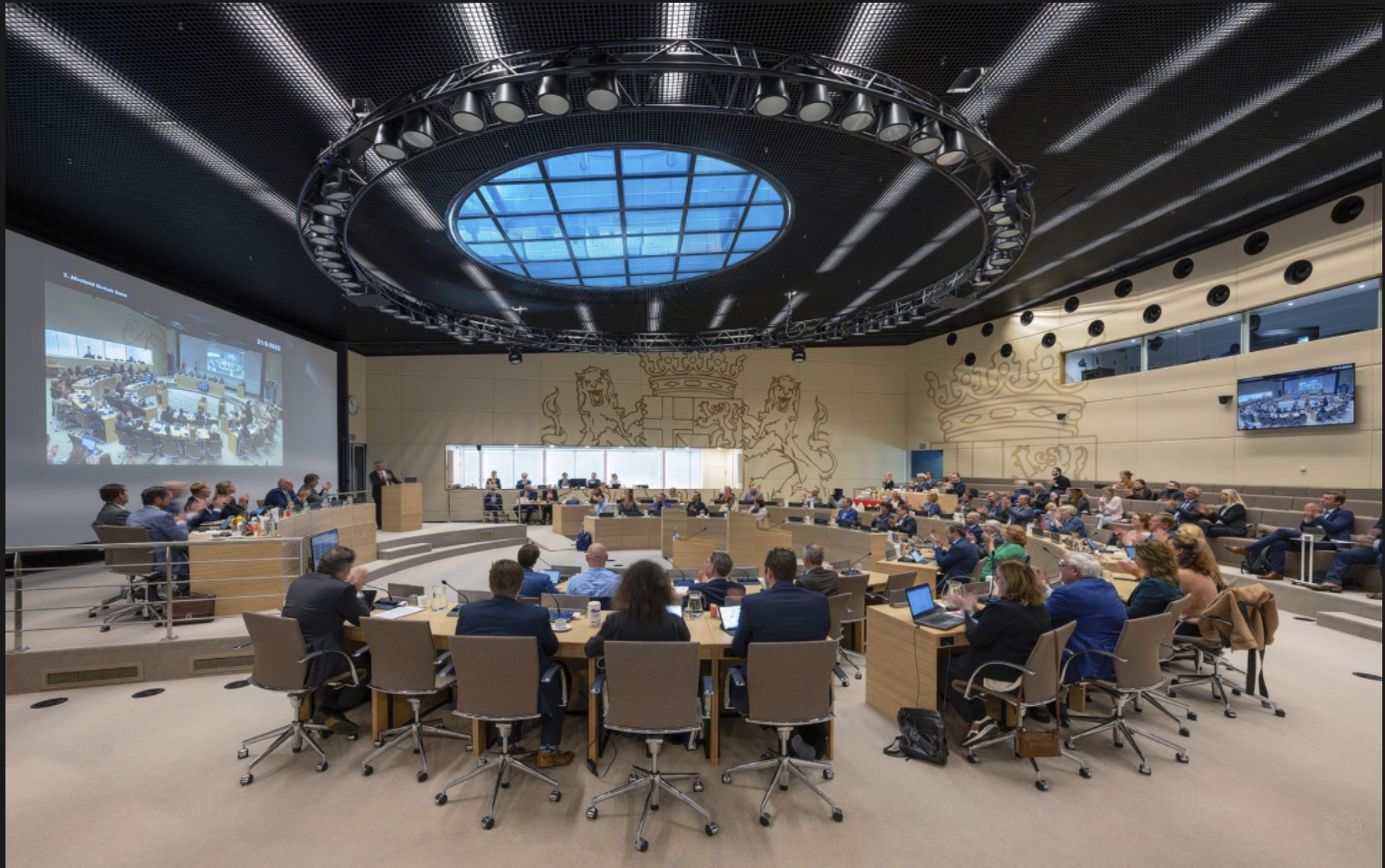
Statenzaal provinciehuis Utrecht. Provinciale Staten van Utrecht zijn sinds 2012 ondergebracht in het door Architecten van Mourik ontworpen gebouw uit 1995 aan de rand van Utrecht. Eerder was het gebouw het hoofdkantoor van Fortis Bank, de bank en verzekeraar die in de financiële crisis van 2008 in moeilijkheden raakte en uiteindelijk in onderdelen werd verkocht.