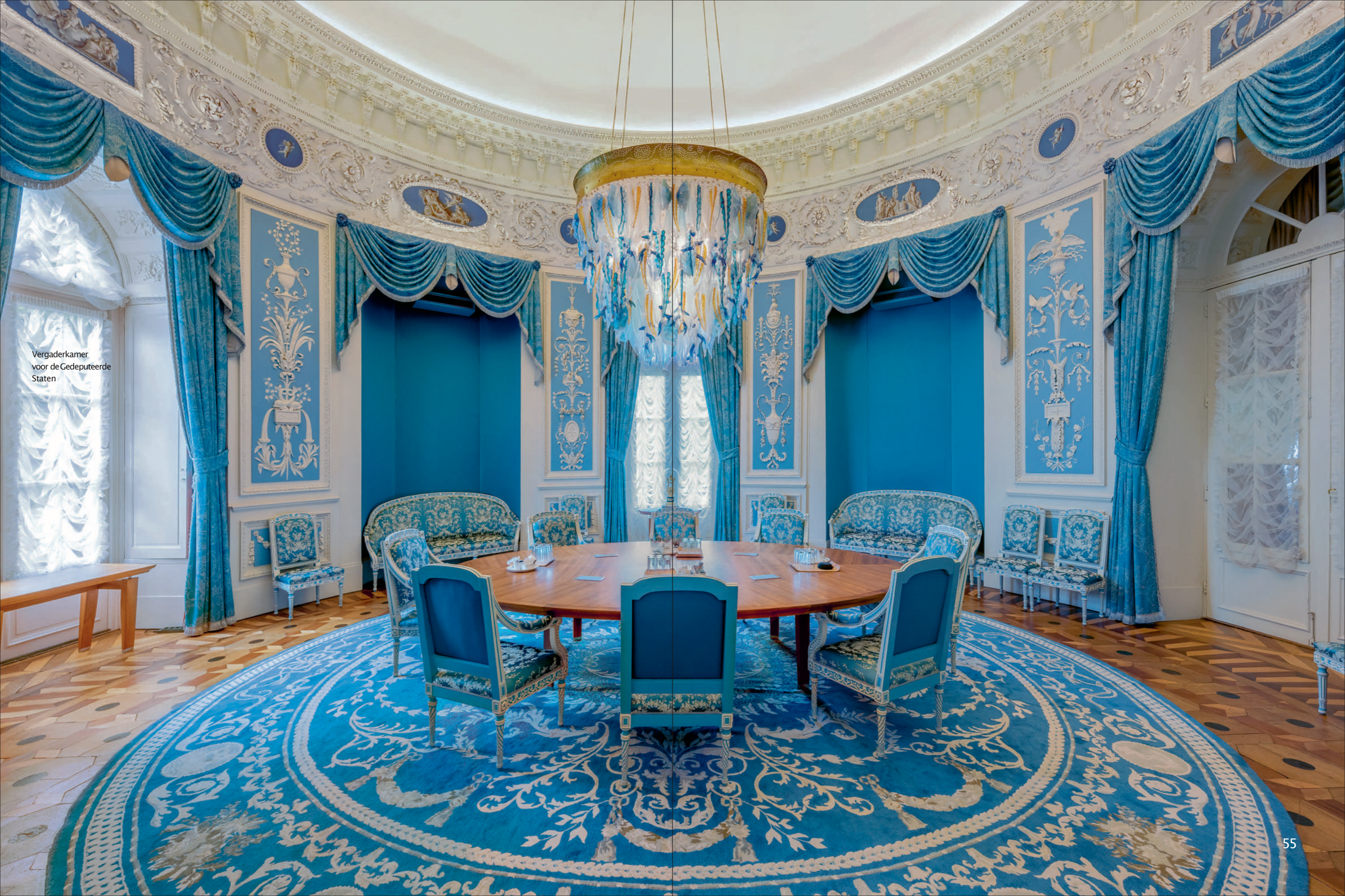
Vergaderkamer voor de Gedeputeerde Staten