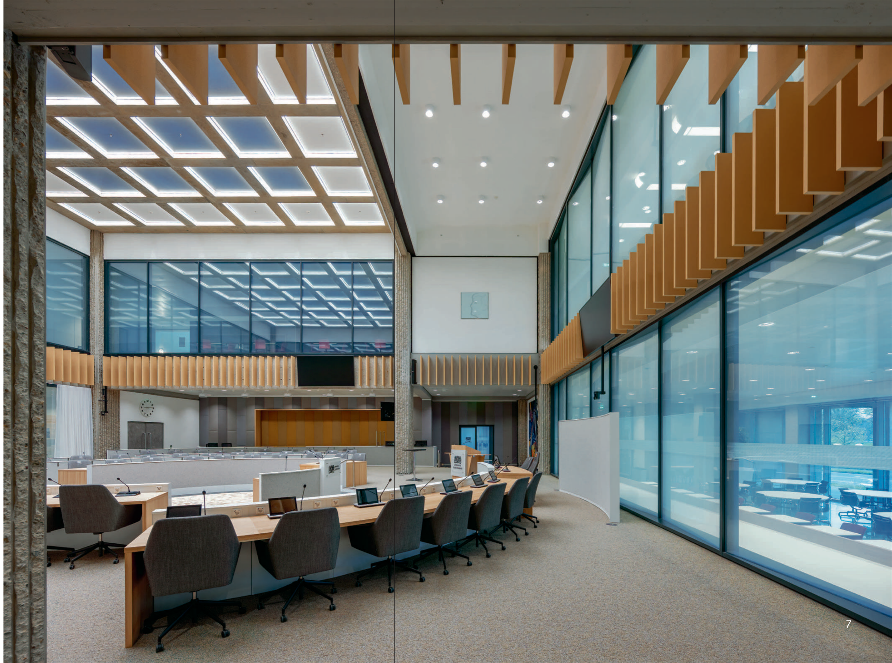
Statenzaal provinciehuis Zuid-Holland