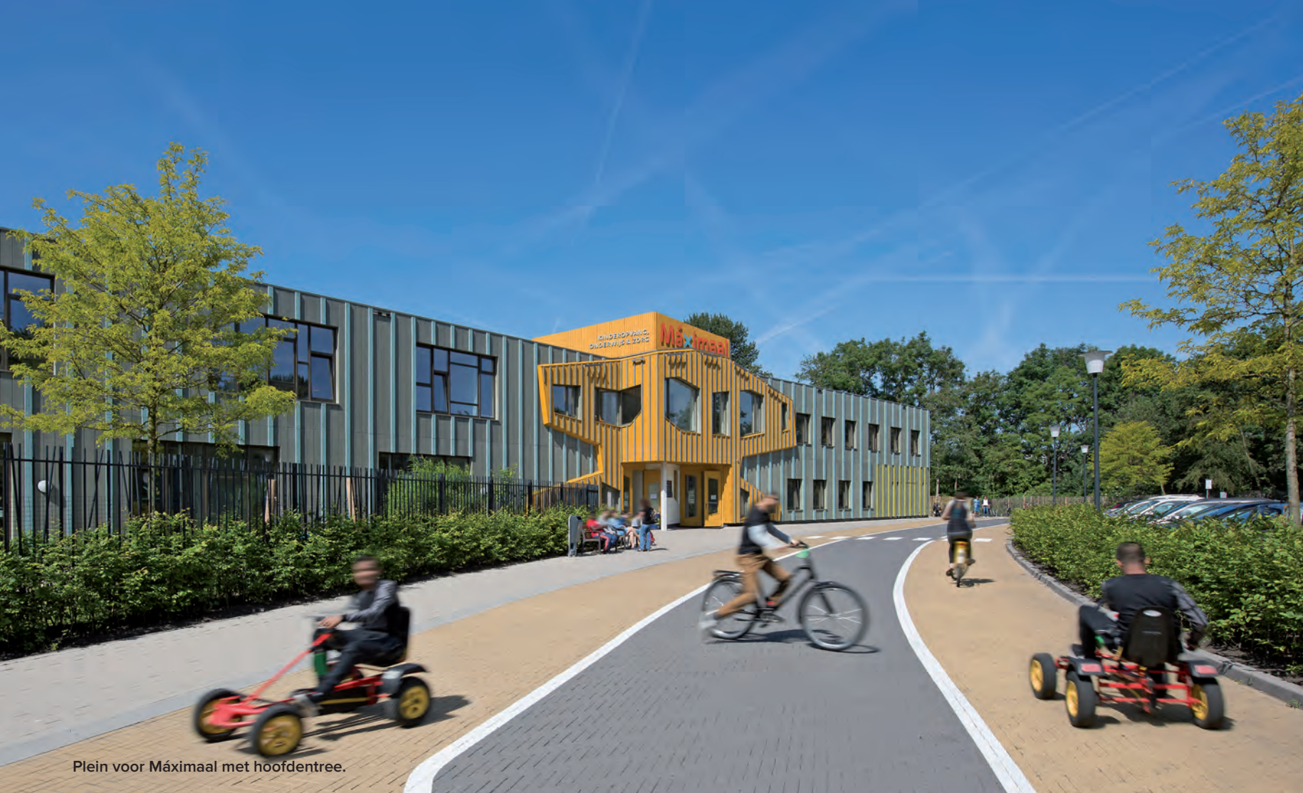
Plein voor Máximaal met hoofdentree.