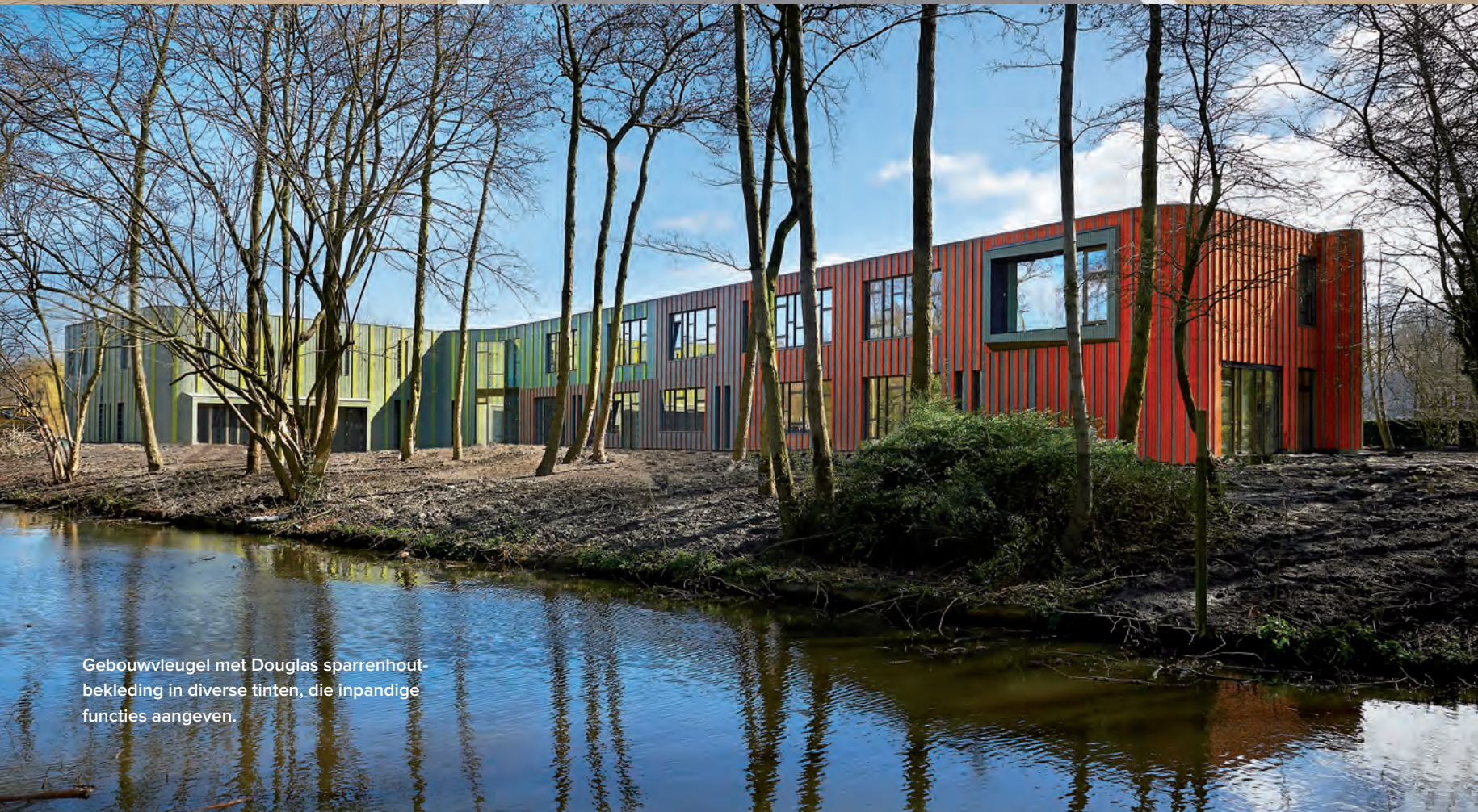
Gebouwwleugel met Douglas sparrenhout bekleding in diverse tinten, die inpandigie functies aangeven.